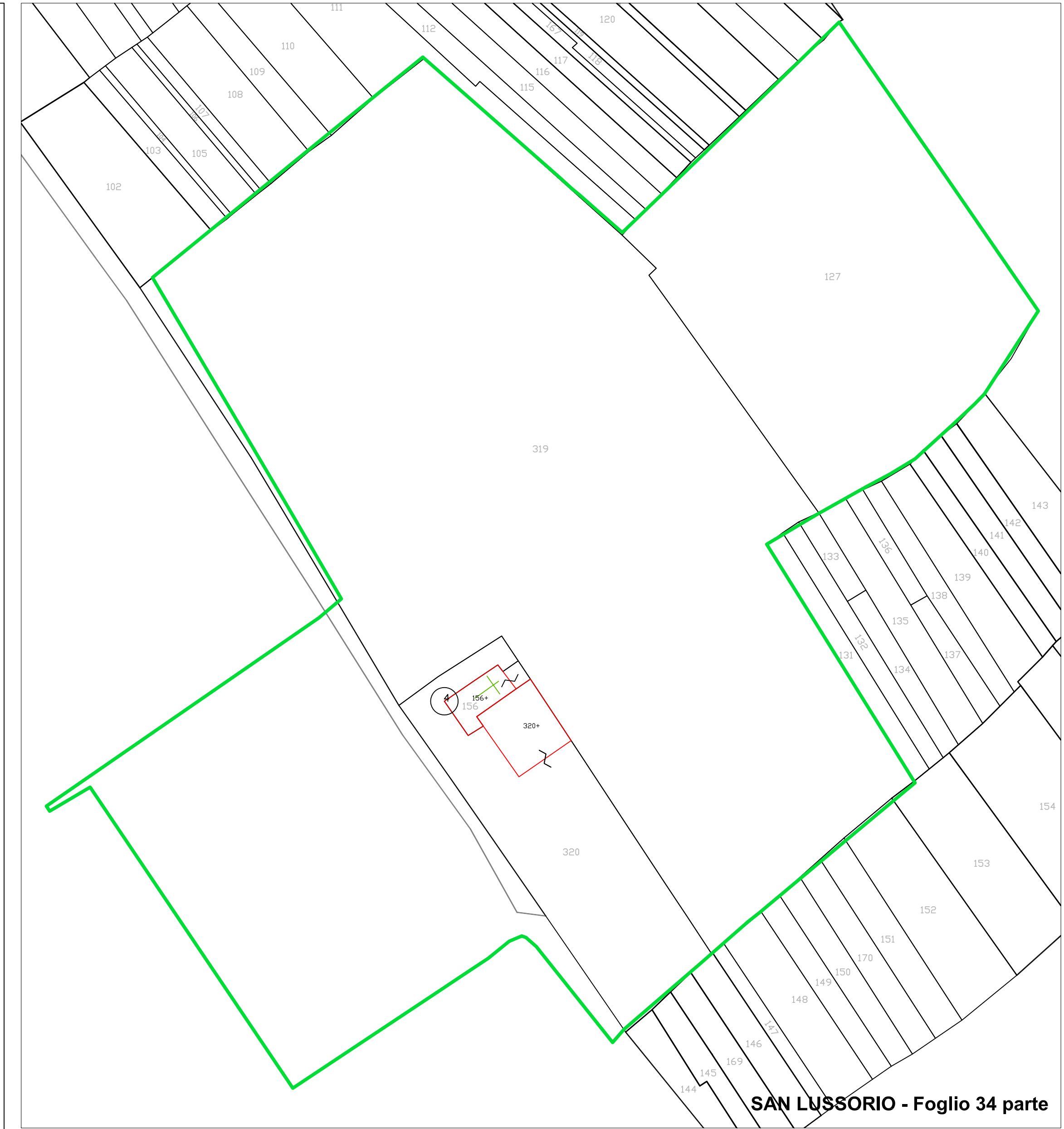
SAN LUSSORIO - Foglio 34 parte

Base cartografica: mappa WEGIS alla data del 7 gennaio 2012