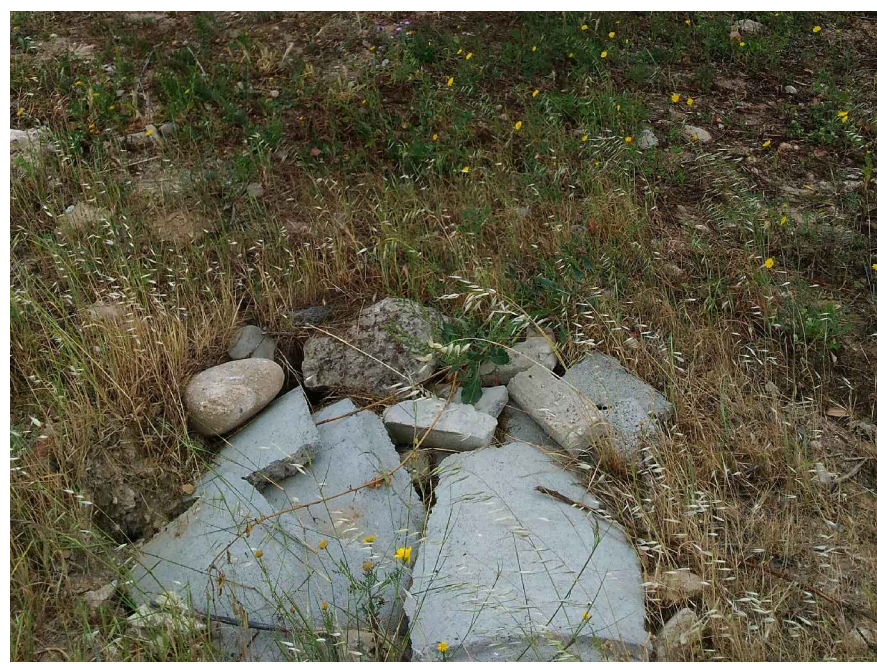
3 - Particolare pozzetto esistente