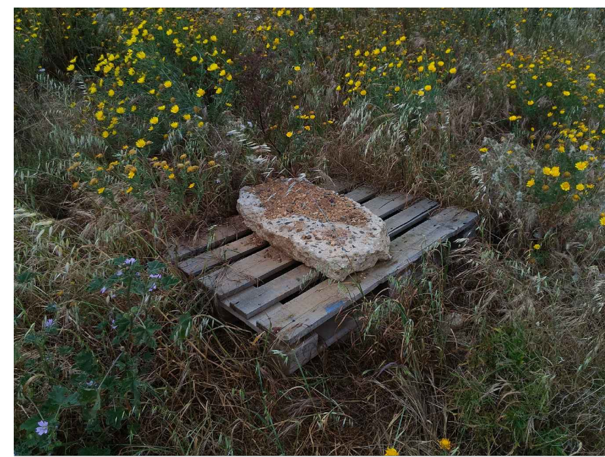
2 - Particolare pozzetto esistente