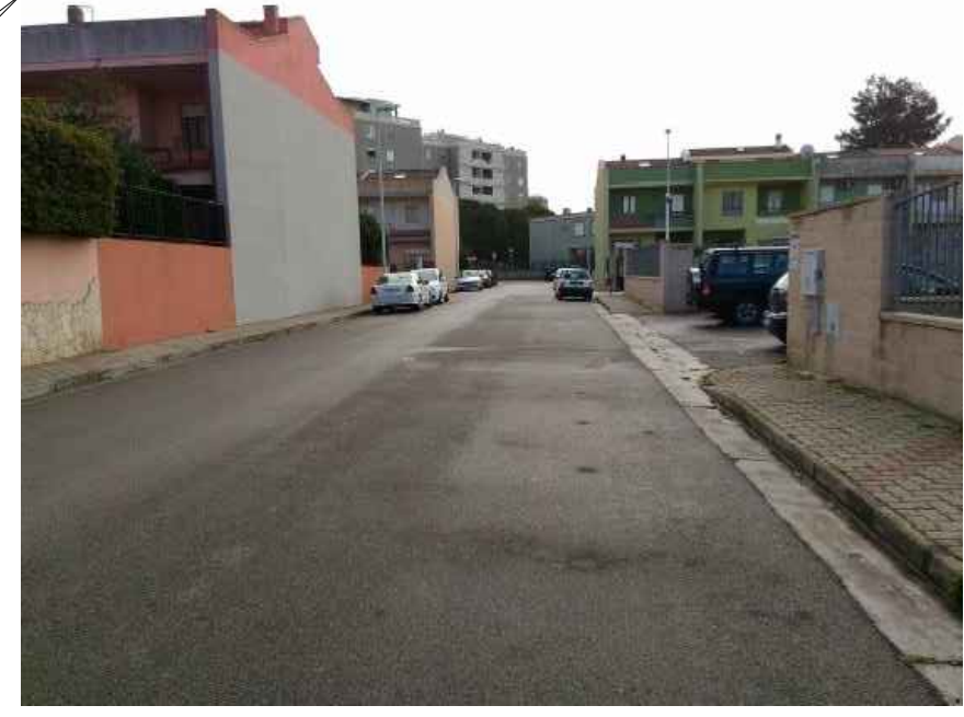
1 - Particolare strada esistente