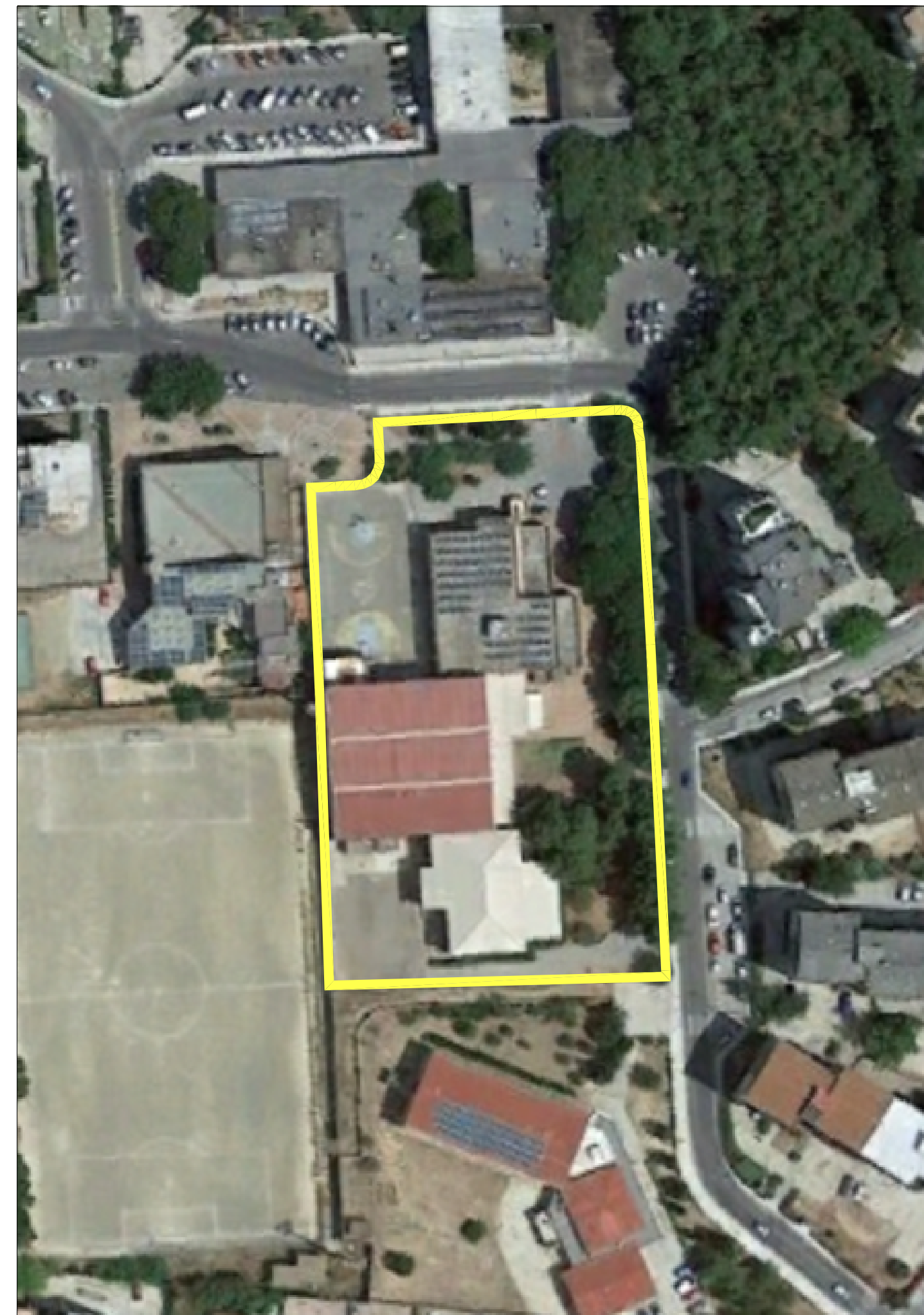
stralcio foto aerea scala 1:1000